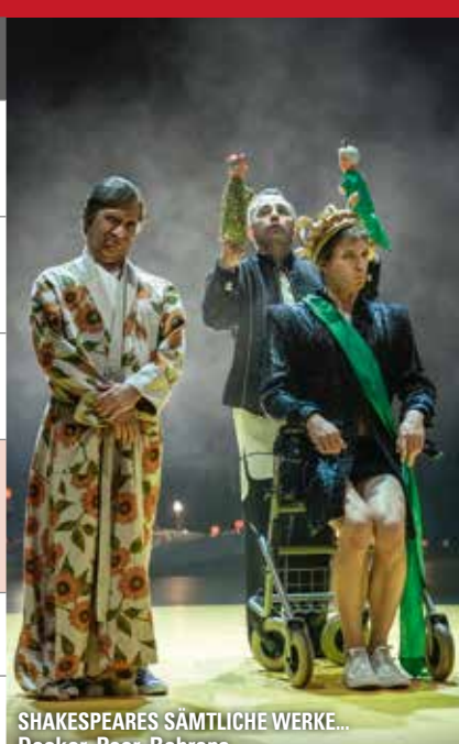
SHAKESPEARES SÄMTLICHE WERKE... Decker, Peer, Behrens