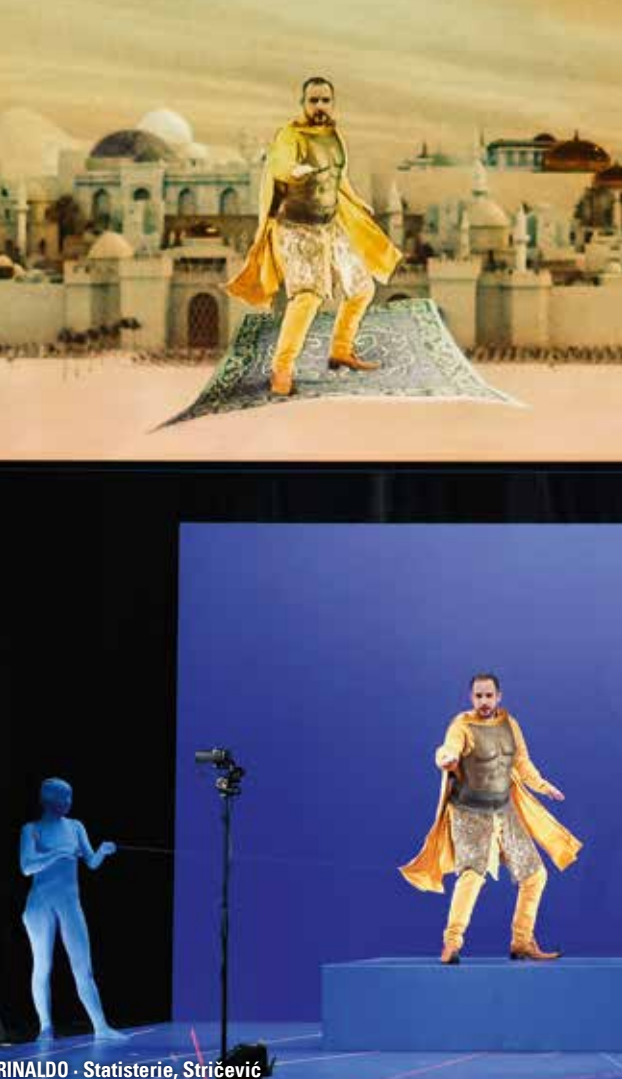
RINALDO - Statisterie, Stričević