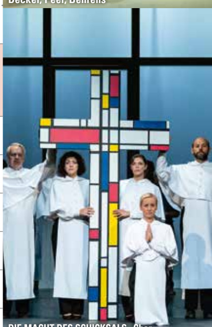
DIE MACHT DES SCHICKSALS - Chor