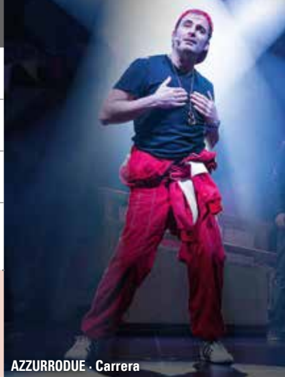
AZZURRODUE - Carrera