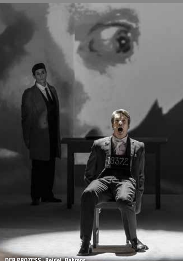
DER PROZESS · Reidel, Behrens

Schauspiel für Kinder von Peter Oberdorf nach den Brüdern Grimm 18., 19., 20. & 21. März 2024 jeweils um 9.00 & 11.00 Uhr