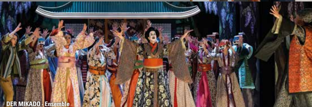
DER MIKADO · Ensemble

Schülervorstellung DER PROZESS Schauspiel von Peter Weiss nach dem Roman von Franz Kafka 13. März 2024 um 10.00 Uhr