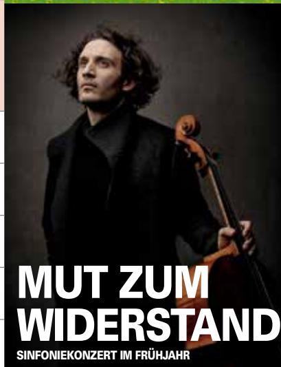
MUT ZUM WIDERSTAND SINFONIEKONZERT IM FRÜHJAHR