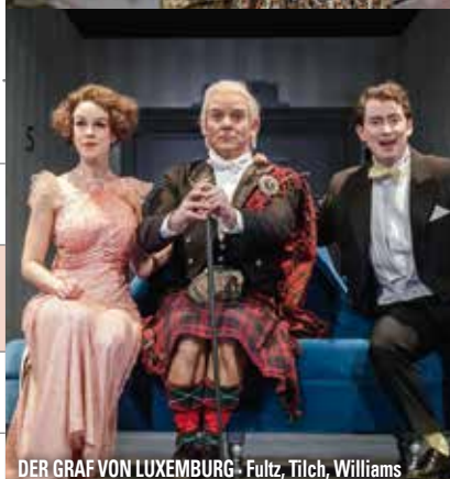
DER GRAF VON LUXEMBURG · Fultz, Tilch, Williams