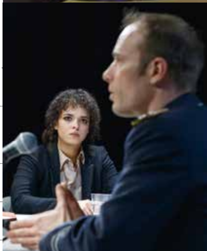
TERROR · Fischer, Moorbach