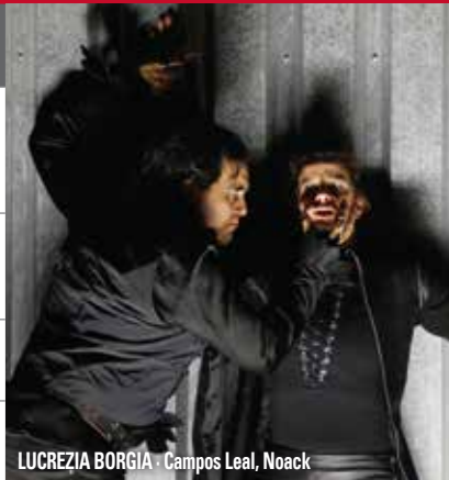
LUCREZIA BORGIA · Campos Leal, Noack