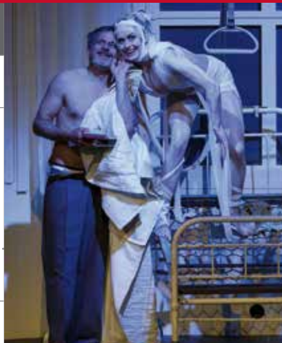
DER BAYERISCHE STURM · Schürmann, Kram