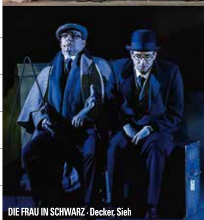
DIE FRAU IN SCHWARZ · Decker, Sieh