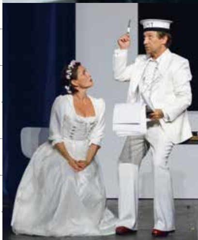
DER BRANDNER KASPAR KEHRT ZURÜCK · Reidel, Decker