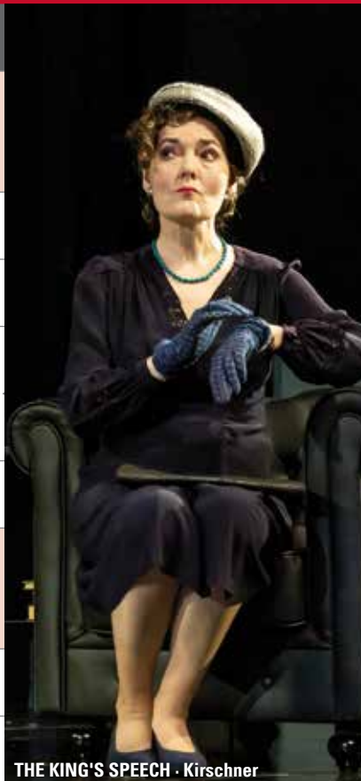
THE KING'S SPEECH · Kirschner