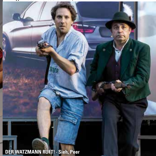
DER WATZMANN RUFT! · Sieh, Peer