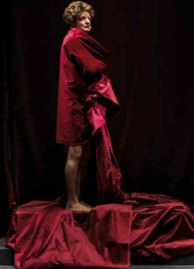
IN EINEM JAHR MIT 13 MONDEN · Vollrath