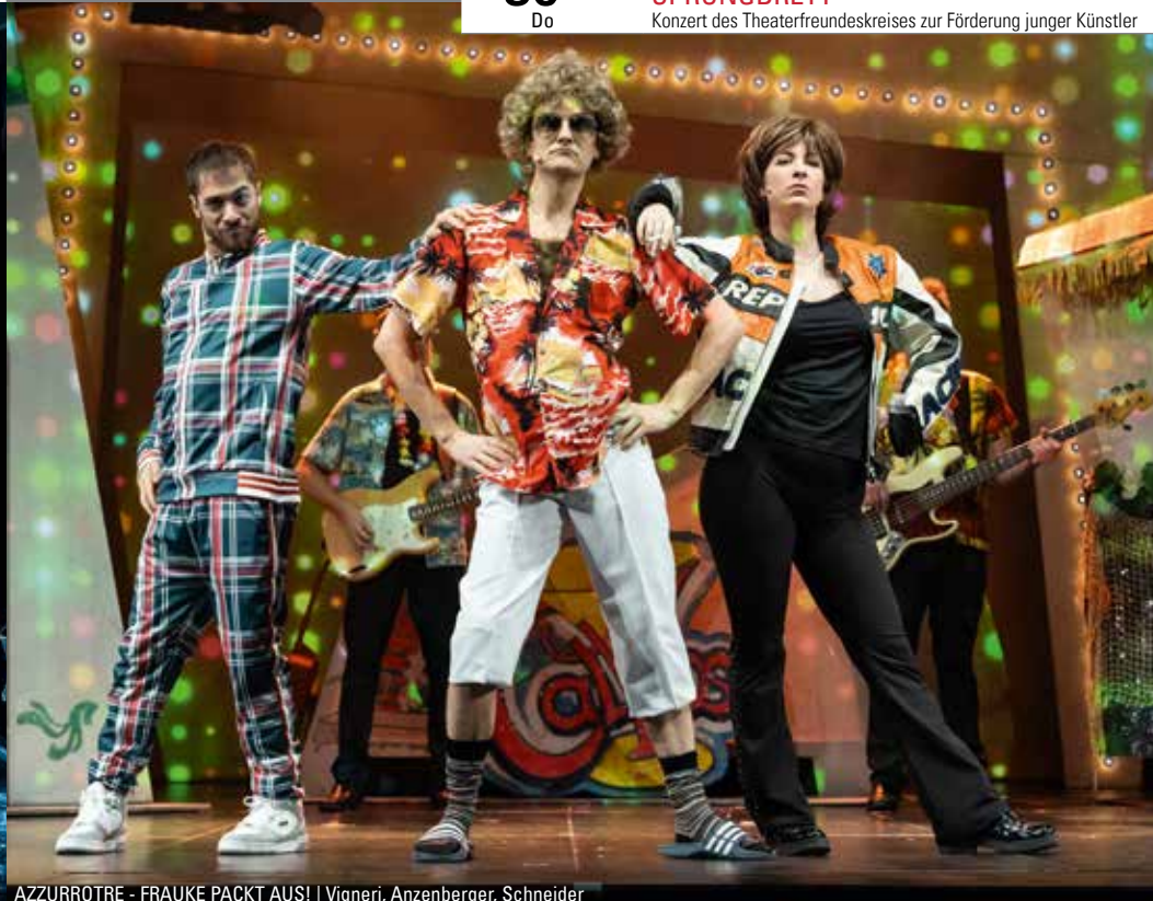
AZZURROTRE - FRAUKE PACKT AUS! | Vigneri, Anzenberger, Schneider