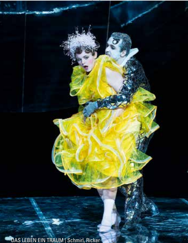
DAS LEBEN EIN TRAUM | Schmiri, Ricker