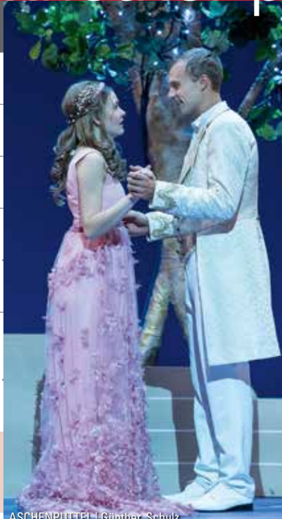
ASCHENPUTTEL | Günther, Schulz