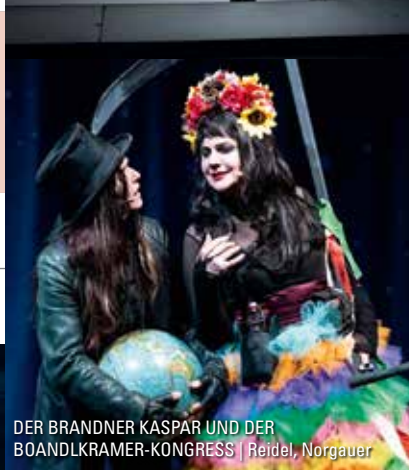
DER BRANDNER KASPAR UND DER BOANDLKRAMER-KONGRESS | Reidel, Norgauer