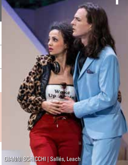
GIANNI SCHICCHI | Sallès, Leach