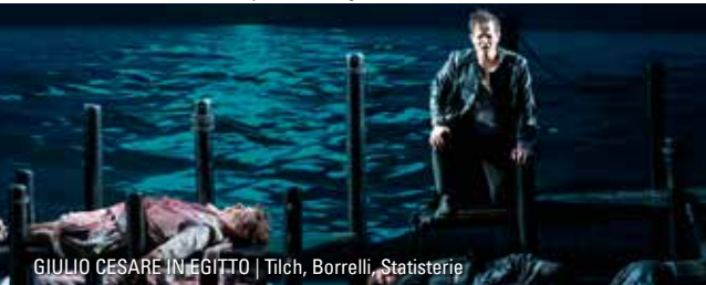
GIULIO CESARE IN EGITTO | Tilch, Borrelli, Statisterie

DER MENSCHENFEIND Molières Misanthrop in der Fassung von Botho Strauß Termin Montag, 4. Mai 2026, um 10.00 Uhr